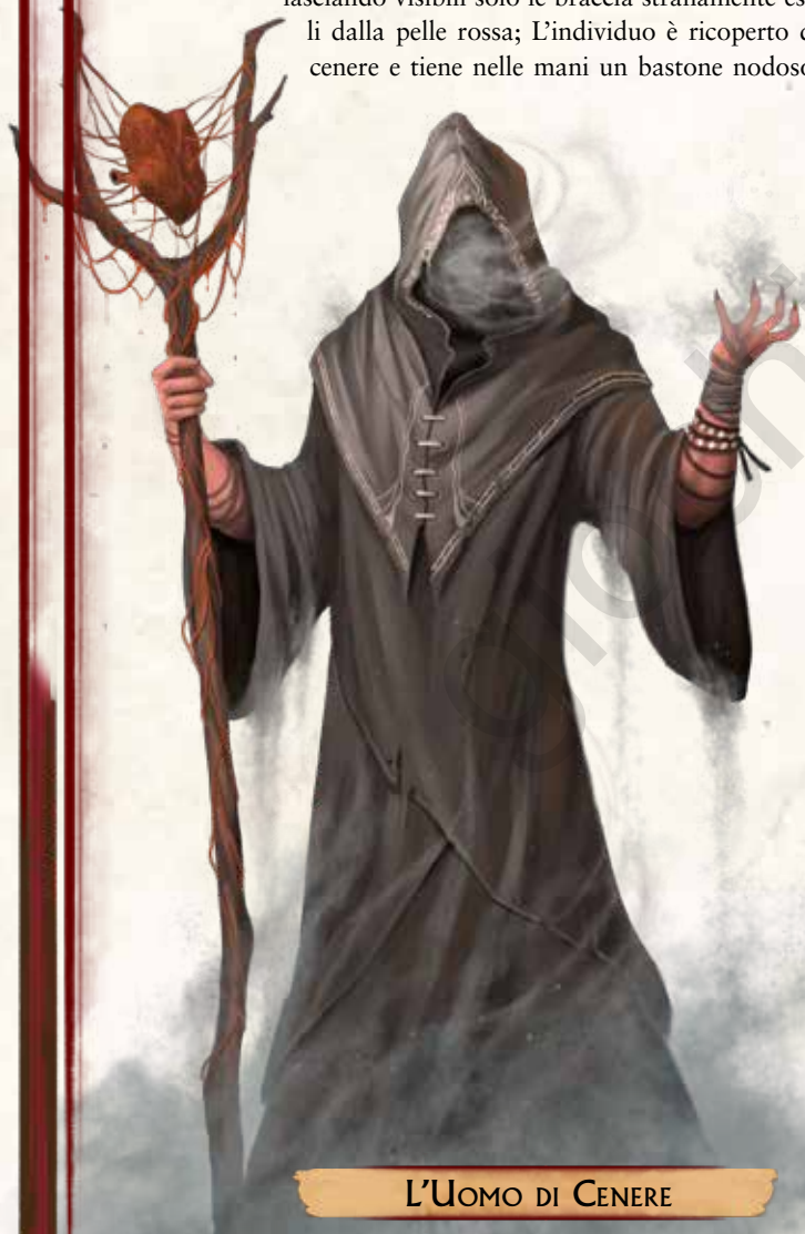
L'UOMO DI CENERE

Quando i PG si avvicinano alla Piazza di Pietravenata per la prima volta, vengono accolti da un insolito individuo sospeso a mezz'aria sopra la voragine. Di forma umanoide e alto 3 metri, indossa un mantello grigio pallido munito di cappuccio che nasconde completamente il suo aspetto, lasciando visibili solo le braccia stranamente esili dalla pelle rossa; l'individuo è ricoperto di cenere e tiene nelle mani un bastone nodoso,